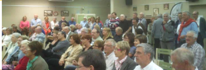
un tournoi magnifique suivi d'une auberge espagnole fastueuse puis ....