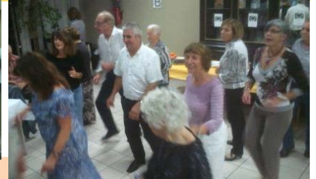
...Musique ! Madison ! Ambiance !