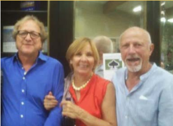
Championne et champion !