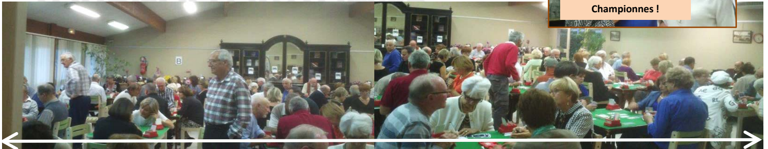
Participation record, on a poussé les murs