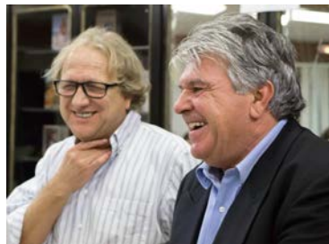
le Maire et le Président