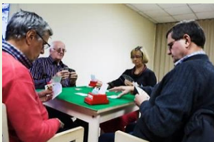
Une concentration exponentielle