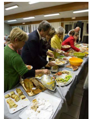
un buffet magnifique