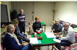
Une motivation exceptionnelle