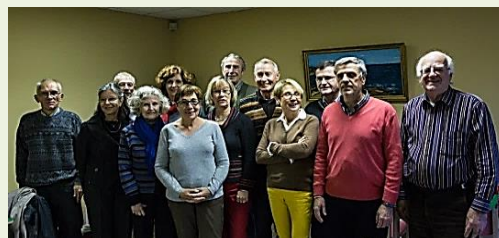
La détermination à toute épreuve des futurs champions du monde