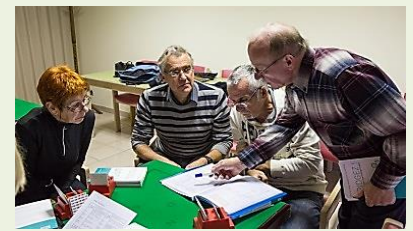
Une pédagogie de très haut niveau