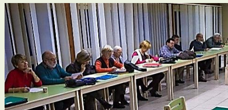
Une classe de cerveaux d'élite mais.... danger !... forte ébullition des neurones !