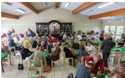
plus de 100 joueurs venus du monde entier