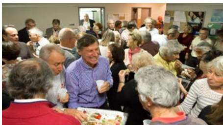
on s'bouscule à l'apéro